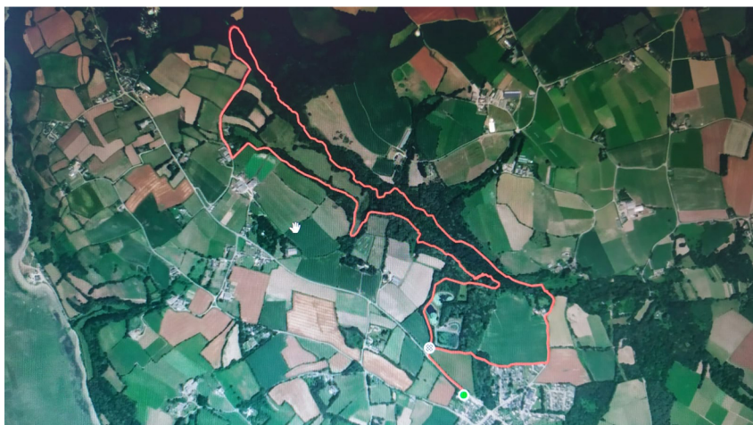
A découvrir, la boucle du Corniou .