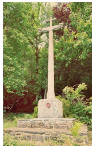
Croaz ar Kouign Aman.