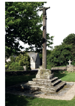
Inscription sur le socle : « IEAN MAHE / 1757 »

Croix située dans le placître de la chapelle Saint-Antoine.